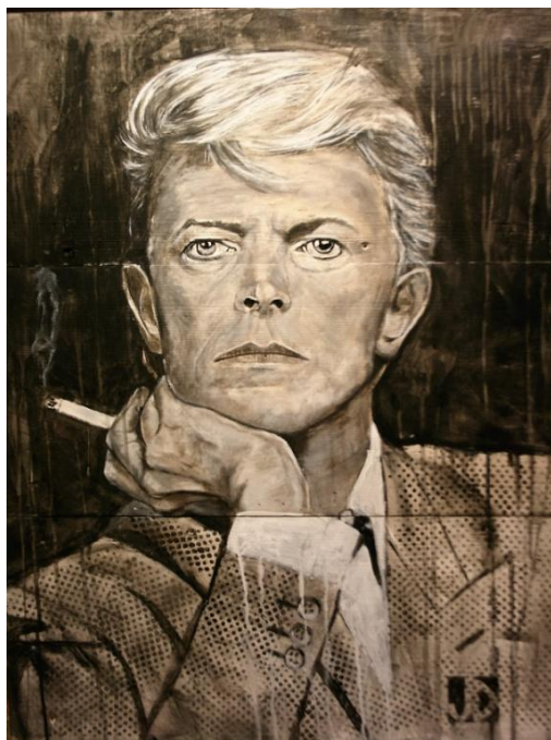
Portret van David Bowie