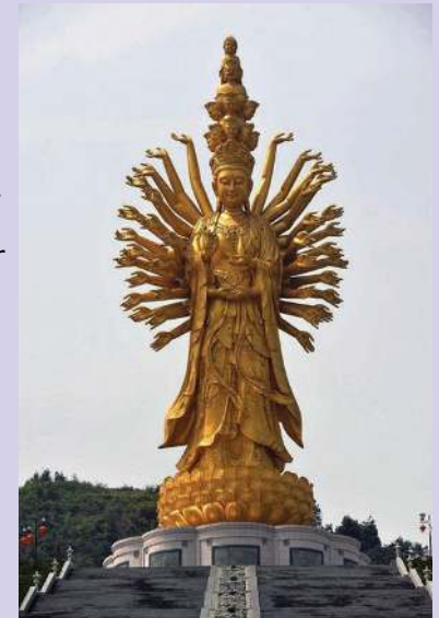
KwanYin van Weishan 99m hoog

c. De volgers van de Dharma vormen de Sangha, de gemeenschap van Boeddhisten uitgebeeld door een monnik met een bedelnap. Alle symboliek rondom de Sangha is gericht op één bepaald doel: het bereiken van het Nirwana, een staat van rust en kalmte, om definitief bevrijd te worden uit de kringloop van wedergeboorte en lijden. De leerling moet leren zich te concentreren op het volledig samengaan van de gehele symboliek van de Drie Juwelen.