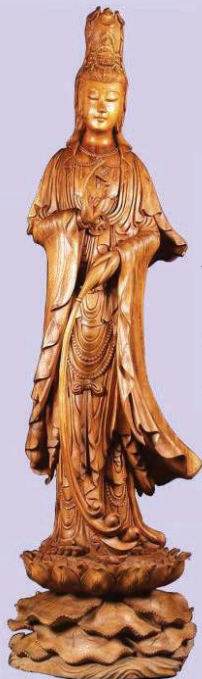
Kwan Yin met levenswater

Water staat voor 'hart, liefde en goed doen.' Zoals water overal naar toe loopt en alles doordrenkt, zo gaat dit ook met dingen, die je met je hart uit liefde doet. Water wordt vaak geofferd in een Boeddhistische tempel en in verband gebracht met de maan, de vrouwelijke voedende kracht van het heelal. Kijken naar stilstaand of stromend water kan een hulpmiddel zijn bij het mediteren. Water wordt uitgegoten over het beeld van Boeddha als gebaar van devotie en toewijding.