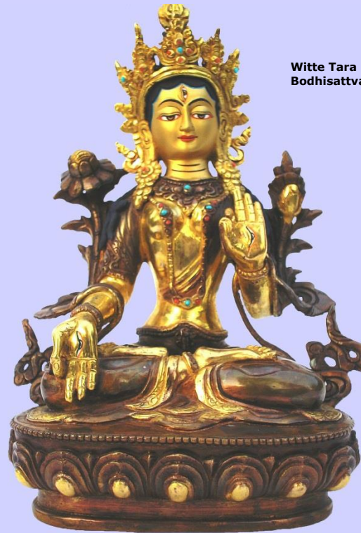
Witte Tara Bodhisattva

Komende vanuit Veendam: neem vanaf de N33 afslag 38 Pekela's. Ronde 1 e afslag N366. Neem na 4,4km afslag Winschoten. Ronde 2 e afslag N367. Hierna 4 de rotonde, de 2 e afslag, Bellingwolde. Ronde 1 e afslag. Ronde 3 e afslag, Blijham. Zodra u in Bellingwolde bent, ga op de kruising bij het Texaco pompstation linksaf. Na ca. 1500m ligt Meubelatelier Allerhanden aan de rechterkant van de Hoofdweg. U kunt uw auto parkeren langs de Hoofdweg.