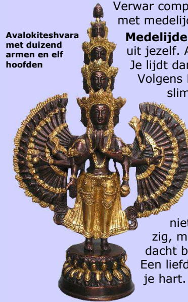
Avalokiteshvara met duizend armen en elf hoofden

Verwar compassie (mededogen) niet met medelijden. Medelijden is je inleven gezien vanuit jezelf. Alsof het jou overkomt. Je lijdt dan met de ander mee. Volgens Boeddha is dat niet zo erg slim. Want dan lijden er twee.